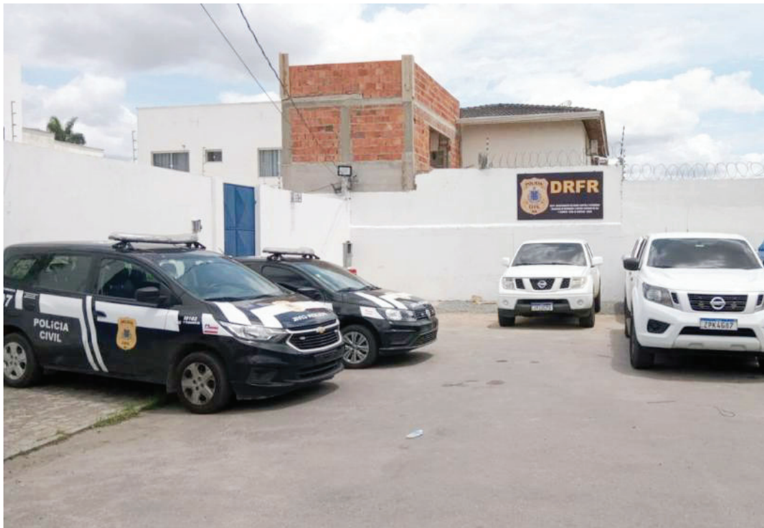
Os cinco cumprimentos de prisão foram pela DRFR