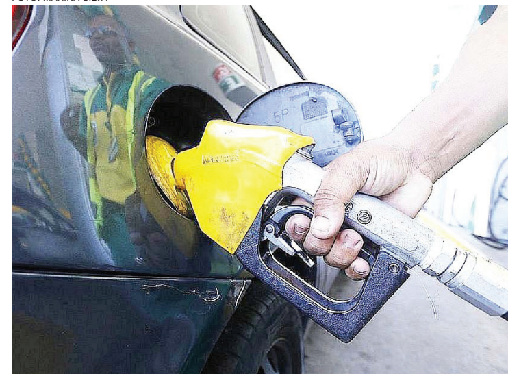
Diesel caiu 7,7% e gasolina 9,25%