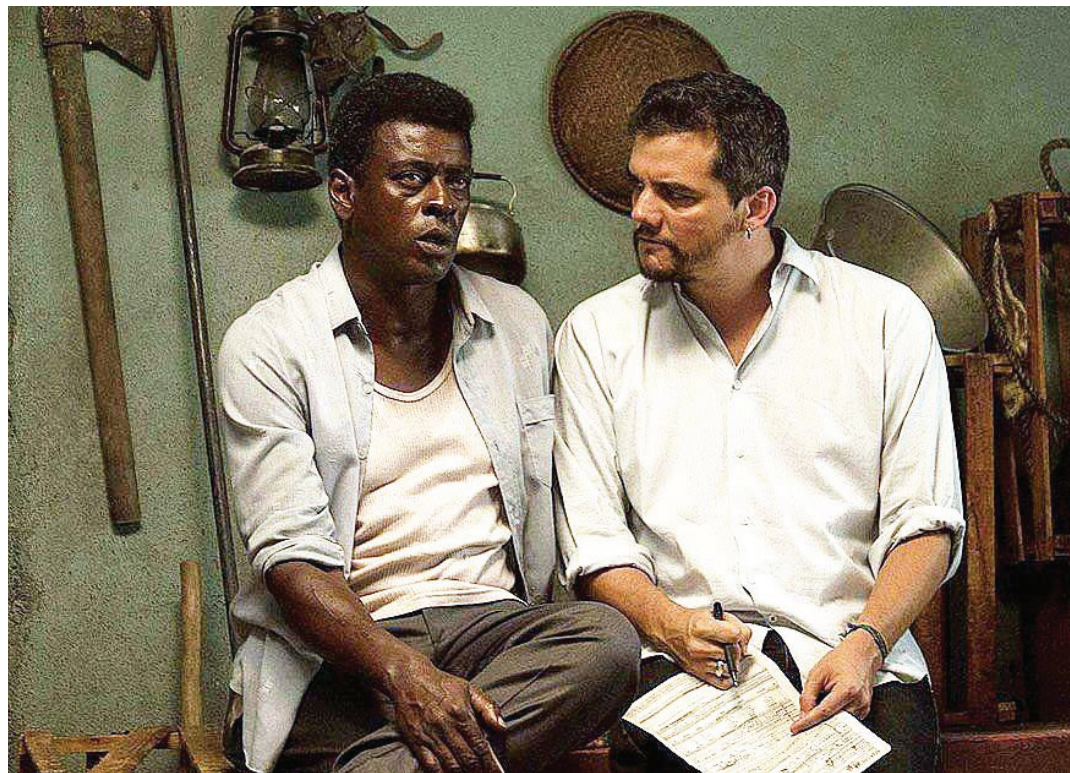
Confira a lista dos principais vencedores