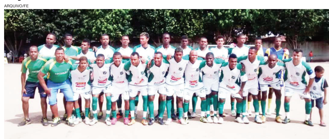
Time conquistou campeonato da Estação Nova em 1997 e 2014

Em tempos áureos, o time chegou a ter um trabalho social na Escola Ana Brandoa, com distribuição de leite para as famílias necessitadas. Conquistou o título de campeão do campeonato da Estação Nova em 1997 e 2014 e do campeonato do bairro Tomba nos anos de 2003, 2005 e 2012. Hoje, o PROJAEC encontra-se disputando a Copa Bahia edição 2022, no Conjunto Uildes Ferreira. “Nestes 37 anos de fundação do PROJAEC, história que fala de companheirismo, parceria, amizades, dificuldades,