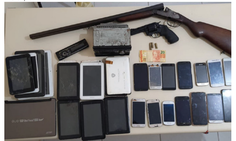
Espingarda de calibre 12 e vários celulares apreendidos pela polícia