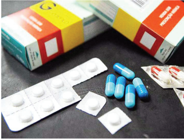
O Brasil só produz 5% desses insumos

do petróleo, provocaram uma corrida dos países em busca de alternativas para evitar futuras crises. Atualmente, o desabastecimento dessa matéria-prima afeta desde a produção de vacinas contra a varíola dos macacos até medicamentos essenciais, como antibióticos e analgésicos.