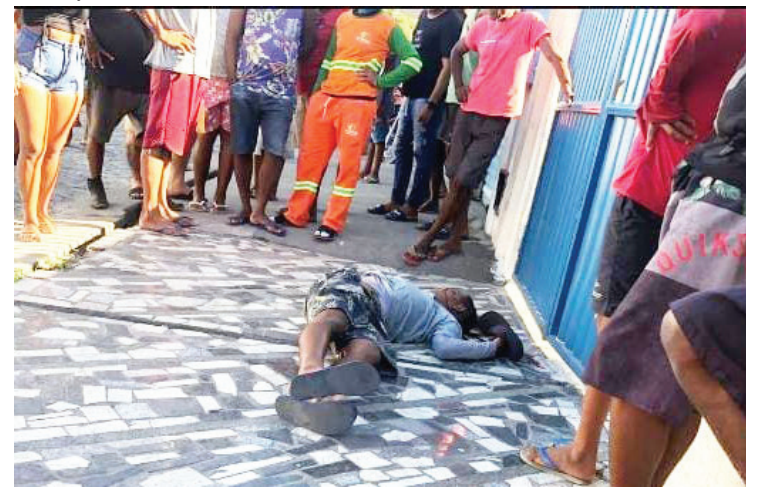
Uma guarnição da Polícia Militar foi acionada e ao chegar, a vítima já estava sem vida