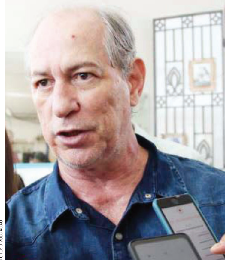
Ciro diz que, caso houvesse oportunidade, votaria no ex-prefeito de Salvador para governar a Bahia

panharam a celebração no santuário de Santa Dulce dos Pobres e durante a tarde se encontraram com um grupo de mulheres empreendedoras no Subúrbio Ferroviário de Salvador.