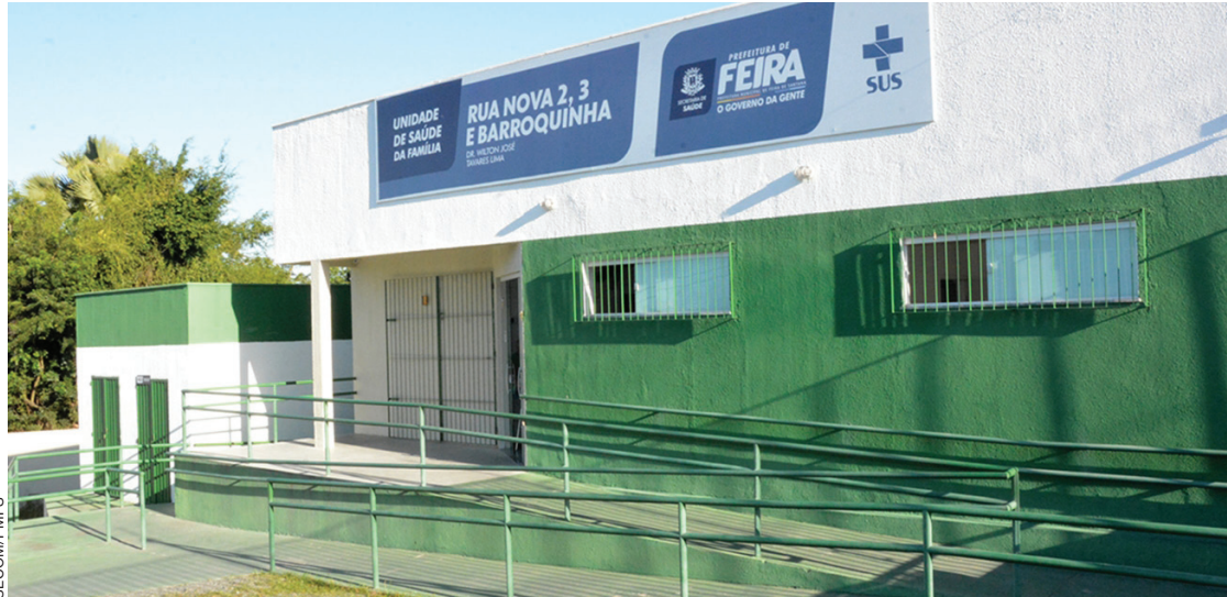
Pessoas com sintomas devem procurar estas unidades

A Prefeitura de Feira de Santana designou unidades de referência para o atendimento de casos suspeitos da varíola dos macacos. São as sete policlínicas municipais, as duas Unidades de Pronto Atendimento (UPA) e mais seis Unidades de Saúde da Família (USF) vinculadas ao programa Saúde na Hora - esta última funciona de segunda a sexta-feira, das 8h às 21h.