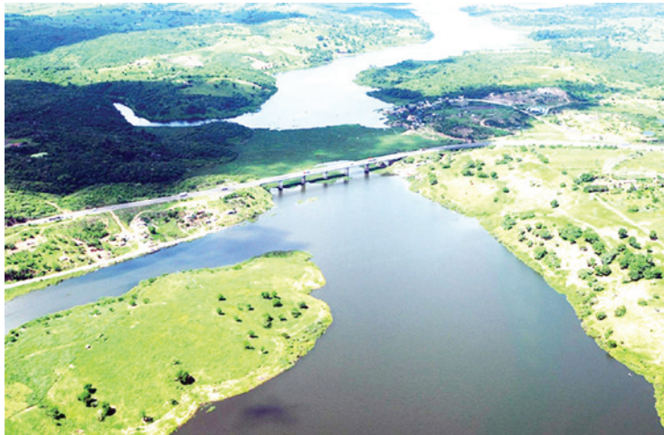
Existem situações de vários tipos sobre o Rio Jacuípe que estão sendo analisadas

ocupação irregular, Riacho da Espuma (localizado no Feira X): despejo de esgoto In-Natura nos Riachos, Rio Jacuípe: Contaminação das águas, desaparecimento de espécies e doenças a população local, entre outros", detalha.