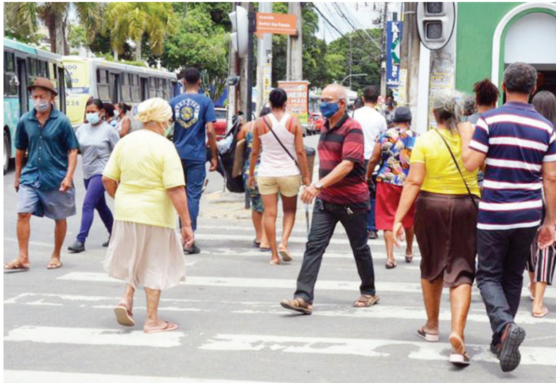
O objetivo é buscar evitar que a cidade passe por uma nova epidemia, desta vez, da varíola dos macacos