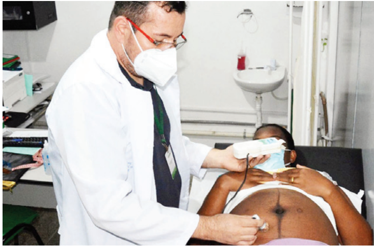
Em sete meses foram prestadas quase 75 mil consultas, entre agendadas e por demanda espontânea

Feira, dispõe de 133 equipes de profissionais que atuam em 96 Unidades de Saúde da Família (USF) e mais uma equipe que assegura o atendimento à população através do programa Consultório na Rua. Além destas, o feirense tem a sua disposição 18 equipes garantindo o atendimento em Unidades Básicas de Saúde (UBS).