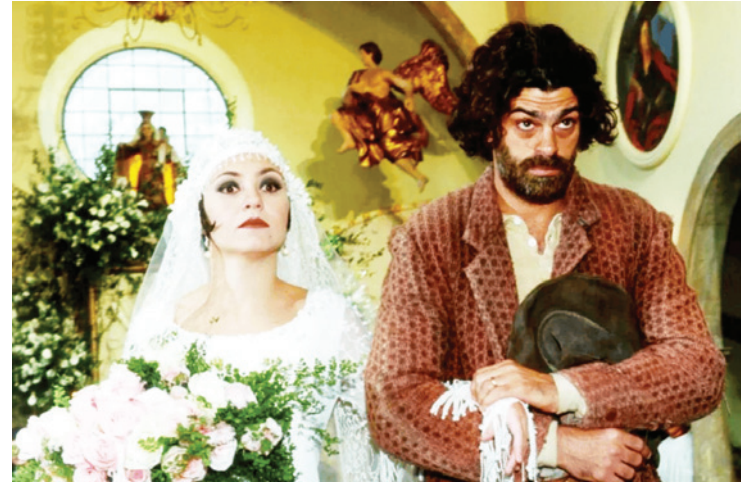
Trama estreia no mês de setembro, na faixa de reprises

bosa, também foi cotada para a faixa de reprise por conta do sucesso de “Pantanal”, mas por não ter tanto humor na história, também foi descartada.