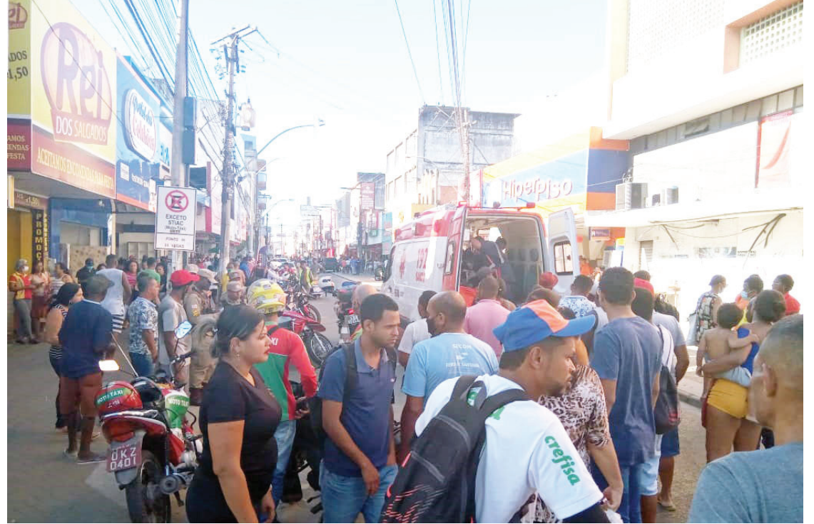
O jovem foi socorrido pelo SAMU e encaminhado para o HGCA